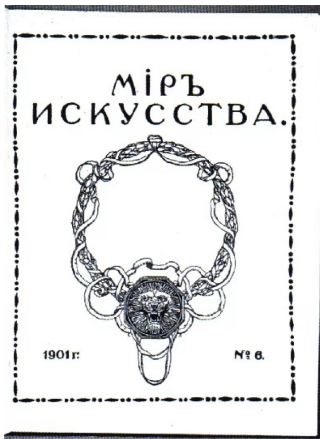
Рисунок 1.5 – Мир искусства